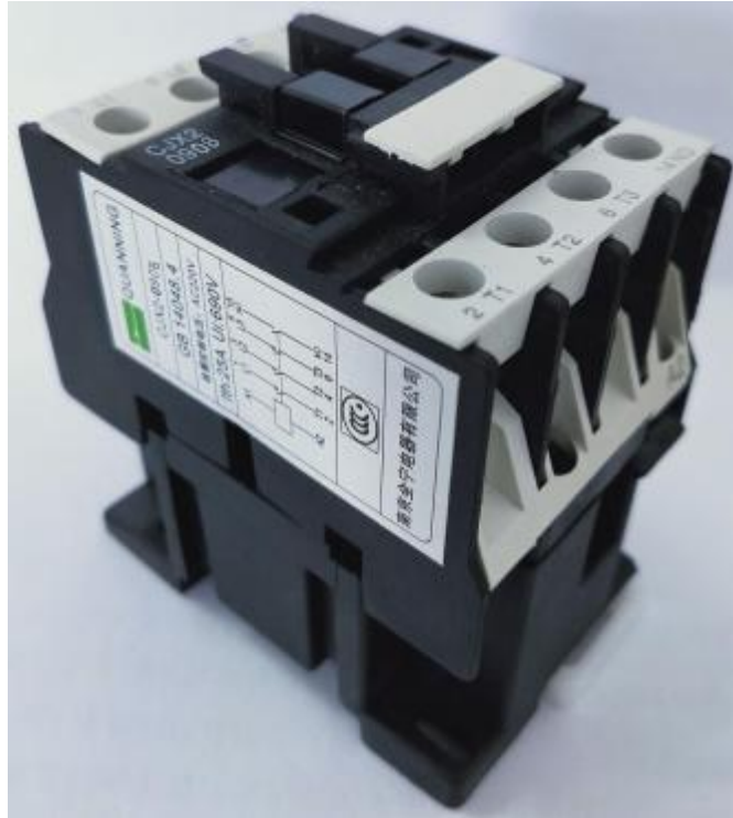
ORDER DESIGNATION (订货标记)